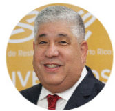
Carlos Budet Presidente Electo

En ASORE, estamos claro del potencial de nuestra industria. Por tal razón redoblamos nuestro compromiso con ser proactivos en nuestras acciones, en defender nuestras posturas y crear alianzas con otras organizaciones en temas que nos unen. En tu rol como profesional de la industria y socio de ASORE, formas parte de este grupo de empresarios que buscamos demostrar que nuestra industria se levanta con mayor fuerza.